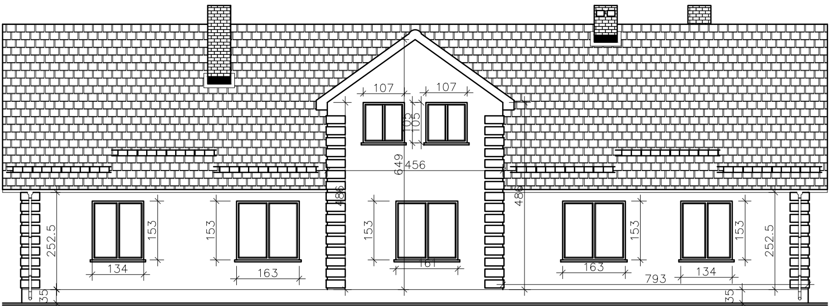
WIDOK ELEWACJI FRONTOWEJ